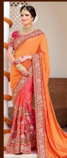
|| 609 ||