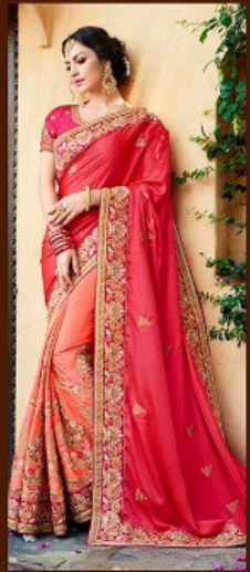
|| 701 ||