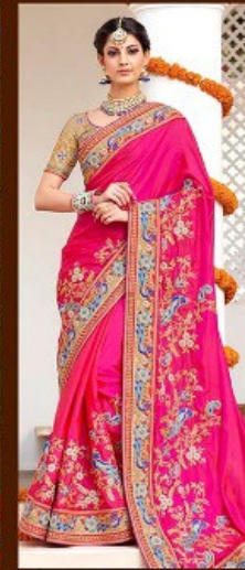
|| 602 ||