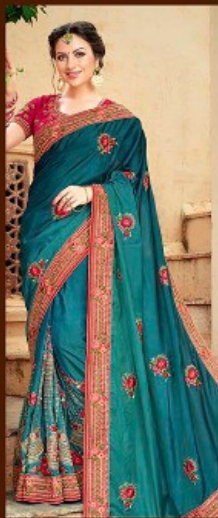
|| 706 ||