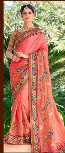
|| 601 ||