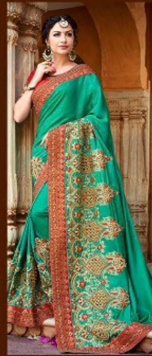
|| 704 ||