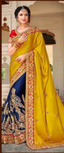
|| 702 ||