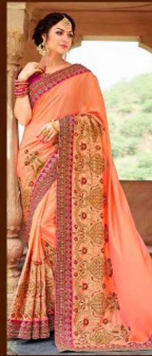
|| 703 ||