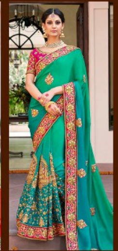
|| 605 ||