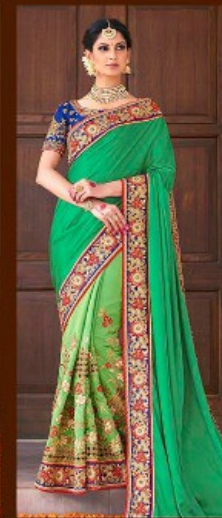
|| 610 ||