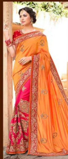
|| 711 ||