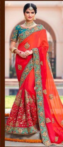
|| 604 ||