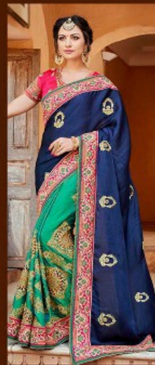
|| 712 ||