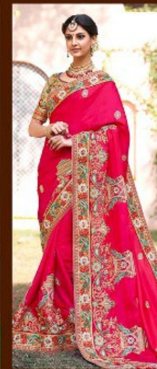
|| 611 ||