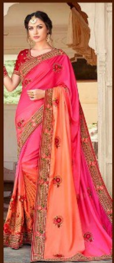
|| 705 ||