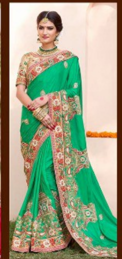
|| 612 ||