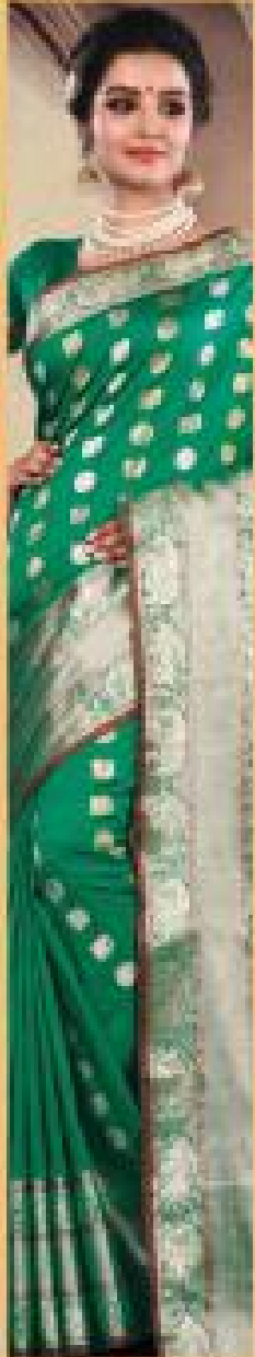
« 2003 »