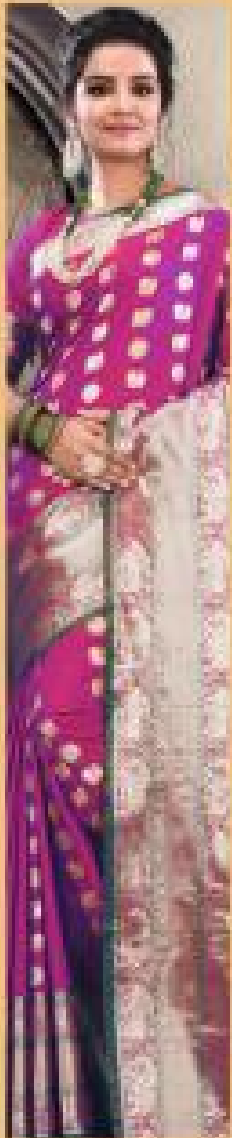
« 2201 »