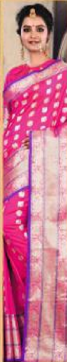
« 2007 »