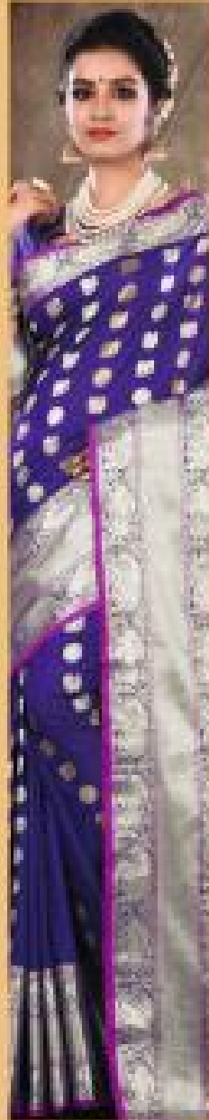
« 2005 »