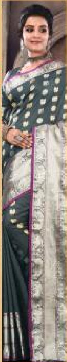
« 2004 »