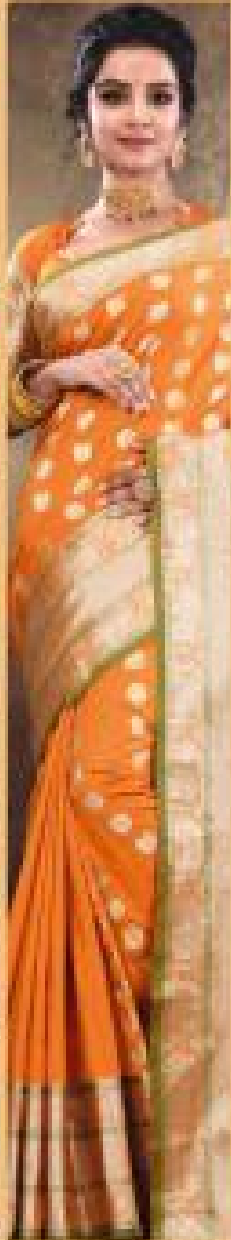
« 2002 »