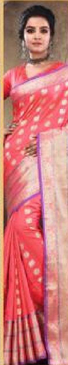
« 2006 »