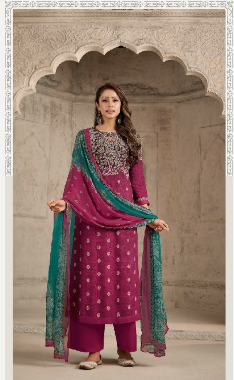
RIYANA - 1001