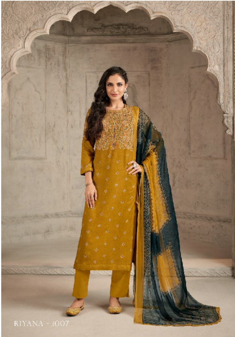
RIYANA - 1007