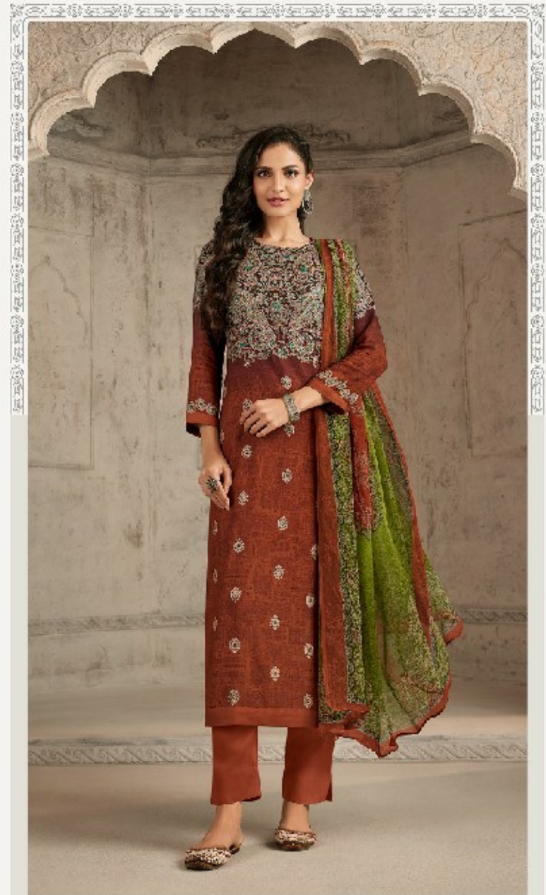
RIYANA - 1010